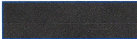
ABRAHAM LEVI MARTÍNEZ VICTORIA MOBILIARIO Y EQUIPO DE OFICINA ROGER, SA DE CV.